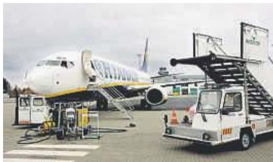
STJAL BIL: En amerikansk kvinne tok seg en tur i en stjålet flyplassbil på Sandefjord Lufthavn Torp i går.

Da mannskapene på flyplassen skulle kjøre henne fra flyet og inn på trygt område, stjal hun bilen deres og begynte å kjøre rundt. Kvinnen skal ha kjørt i området der flyene står parkert etter landing. Ferden endte i ei snøfonna.